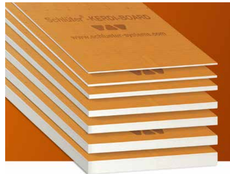
Pannello universale per impermeabilizzare rivestimenti ceramici