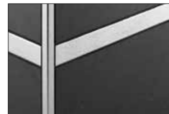
acciaio inox con finitura ES 1