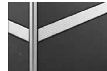
acciaio inox con finitura ES 1