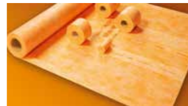
Schlüter®-KERDI Impermeabilizzare con facilità docce, piscine ed ambienti umidi.