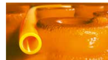
Schlüter®-BEKOTEC-THERM Il riscaldamento a pavimento di terza generazione.