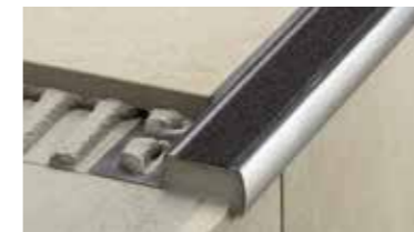
Schlüter®-TREP Più sicurezza con i profili per gradini Schlüter-Systems.