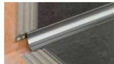
Schlüter®-DILEX Giunti di dilatazione e giunti perimetrali

Se desiderate ricevere maggiori informazioni sui prodotti della gamma Schlüter-Systems potete richiedere i seguenti flyer informativi presso il vostro rivenditore oppure visitare il nostro sito www.schlueter.it .